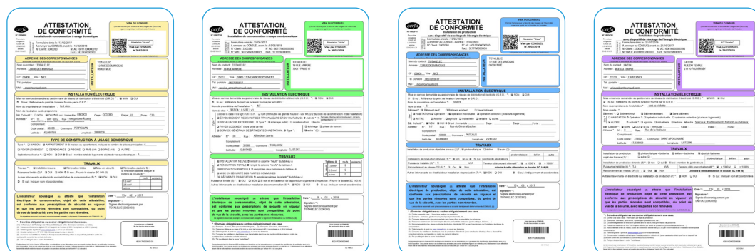
Les Attestations de Conformité